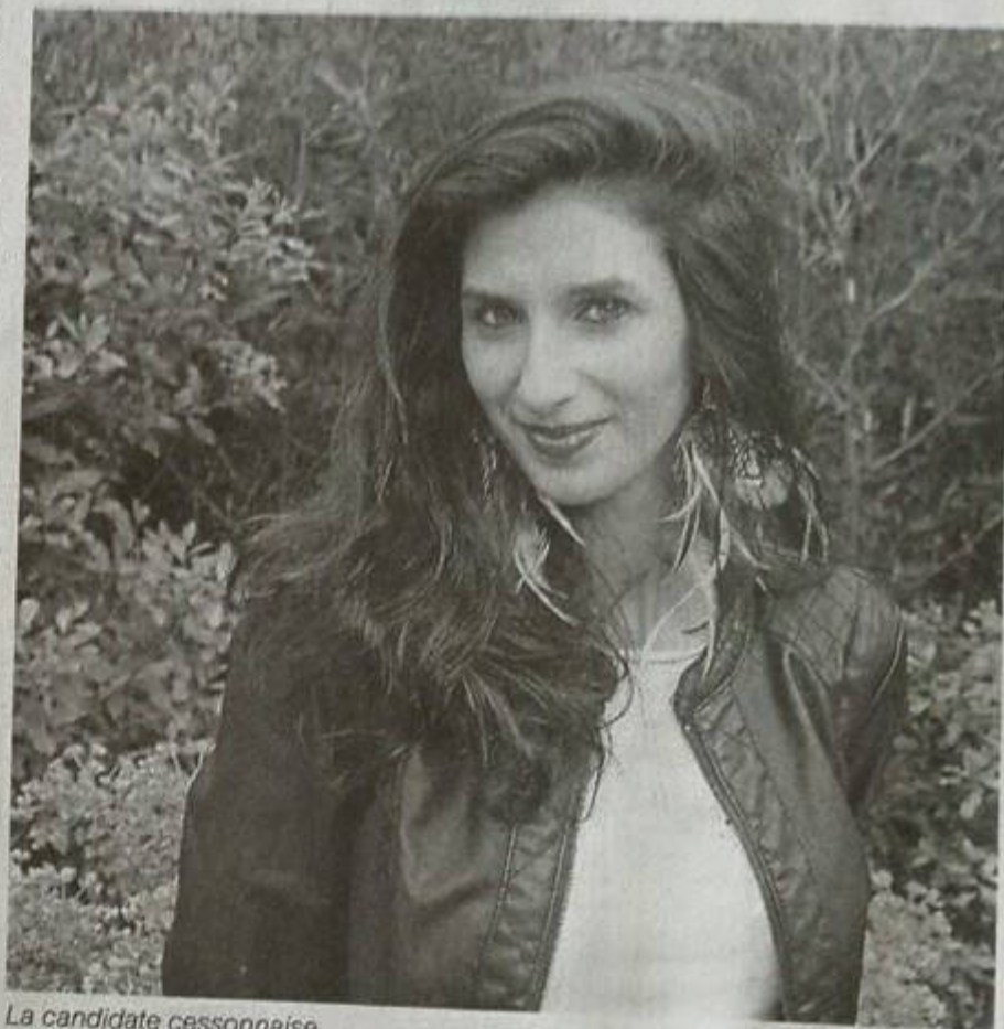
La candidate cessonnaise.

Samedi 9 mai ,   20 h 30,  lection Miss Handi Bretagne, salle de l'Asphod le,   Questembert (56). Contact et r servation au 06 30 67 70 04. Entr e 7  . Gratuit pour les moins de 12 ans.