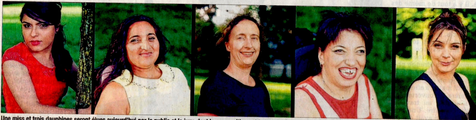
Une miss et trois dauphines seront élues aujourd'hui par le public et le jury, dont la composition est tenue secrète pour assurer le bon déroulement du concours de beauté.